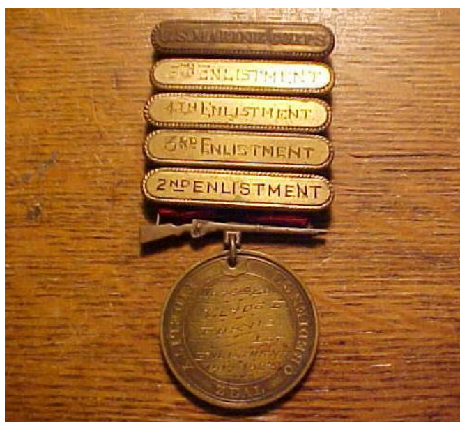
Exemplo de medalha com barras até o 5º alistamento

Até 1953 também eram afixadas a fita as chamadas “Barras de Alistamento”, essas barras substituíam a concessão de medalhas adicionais a cada novo período aquisitivo. As mesmas continham na frente o número do alistamento mais recente e no verso era gravado o período daquele alistamento. Após janeiro de 1953 as barras de alistamento foram substituídas pelas Estrelas de Serviço.