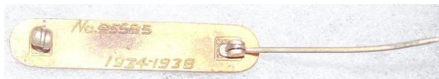
Gravação dos dados do alistamento atrás da barra

Desde a sua introdução as primeiras medalhas traziam um número estampado na sua borda, começando do número 1. Também era uma prática usual nas primeiras medalhas ter o nome do recipiente manualmente gravado no verso, assim como o seu número e o período do primeiro alistamento.