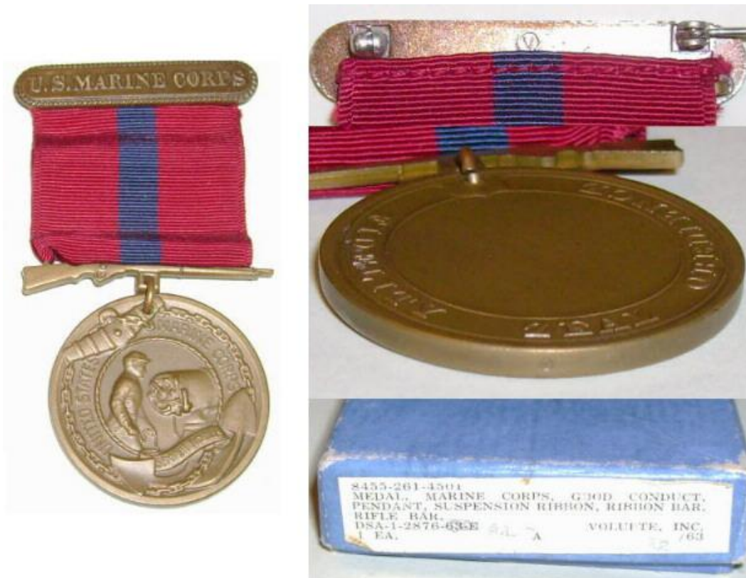
Exemplo de medalha produzida em 1963, com exceção das marcações na borda e atrás da barra é idêntica as feitas durante a WWII

Até 1953 também eram afixadas a fita as chamadas “Barras de Alistamento”, essas barras substituíam a concessão de medalhas adicionais a cada novo período aquisitivo. As mesmas continham na frente o número do alistamento mais recente e no verso era gravado o período daquele alistamento. Após janeiro de 1953 as barras de alistamento foram substituídas pelas Estrelas de Serviço.